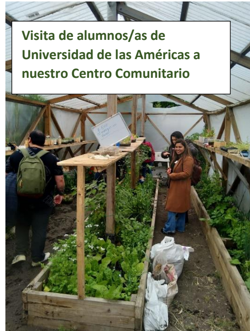
Visita de alumnos/as de Universidad de las Américas a nuestro Centro Comunitario