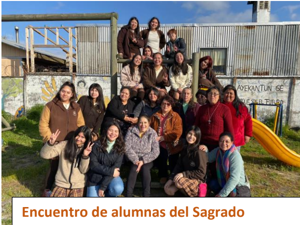
Encuentro de alumnas del Sagrado Corazón de Concepción con mujeres del taller Domoche