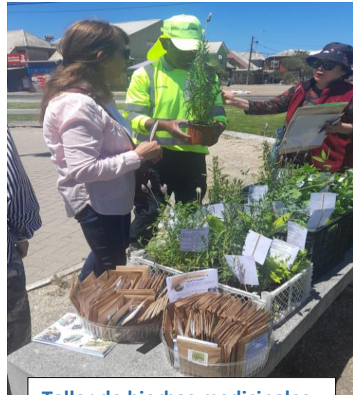
Taller de hierbas medicinales compartiendo en el barrio