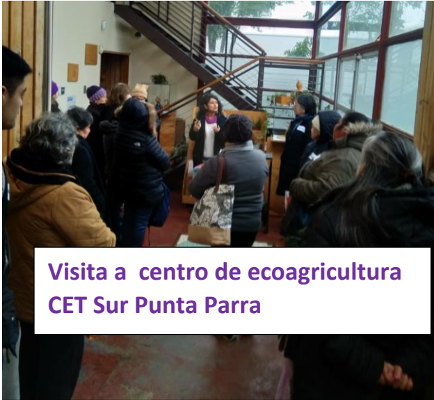
Visita a centro de ecoagricultura CET Sur Punta Parra